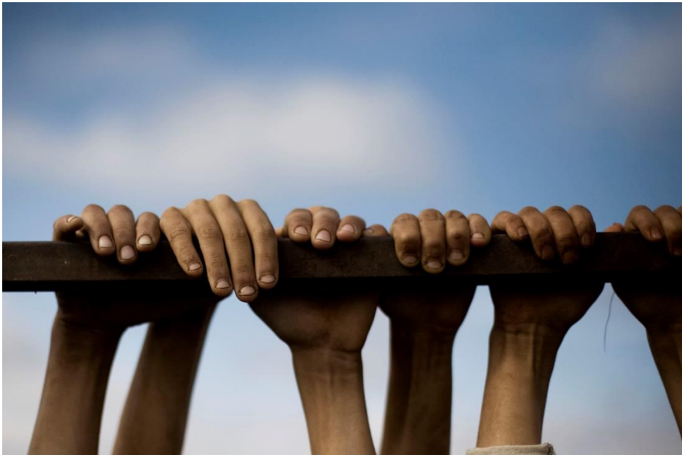
난민캠프의 아이들 Manu Brabo (2012 / Atma, SYRIA)