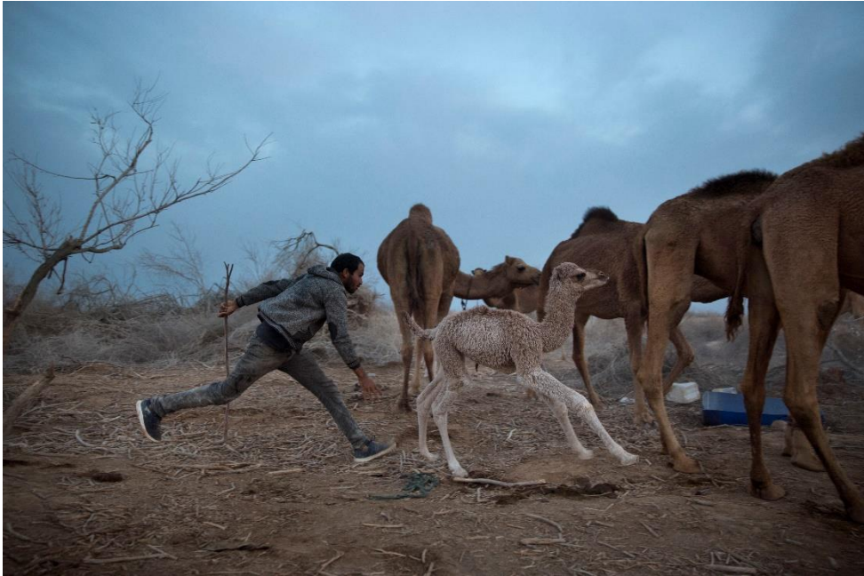
아기 낙타와 양치기 Oded Balilty (2018 / Kalya, PALESTINIAN TERRITORIES)