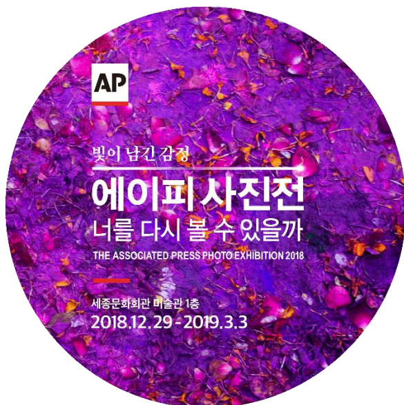
사진 속 주인공은 기분이 어떨까요?